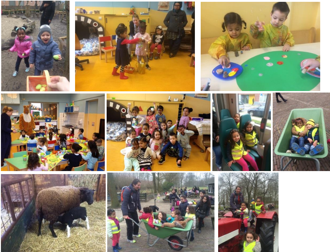
Locatie het Kasteeltje